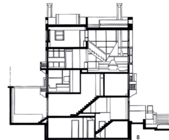
7 Marcel Duchamp, Γυμνό που κατεβαίνει τη σκάλα, αρ. 2, 1912, Museum of Art, Φιλαδέλφεια

Σκάλα. Η Σουζάνα Αντωνακάκη αναφέρει: "Η σκάλα - σκηνή παίζει ένα θεατρικό ρόλο σα στοιχείο του χώρου, αλληλά και προσφέρεται για την έλευση, τη στάση ή την απομάκρυνση των κατοίκων που θεωρούνται, αλληλά και θεωρούν. Η σκάλα υποδέχεται τους θεατές που παρακολουθούν τα δρώμενα που εκτυλίσσονται στη σκηνή. Δηλαδή στο χώρο στον οποίο ανήκει η σκάλα. Οι σκάλες σαν επιμήκειες δέσμες στο ύπαιθρο ή στον εσωτερικό χώρο, εκτός από τη θεατρική παρουσία τους, είναι και στοιχεία που αποσαφηνίζουν σχέσεις μεταξύ επιπέδων ή μεταξύ διαφόρων κτιρίων, οικοδομημάτων" (Σ. Αντωνακάκη, 1990, σ.7).