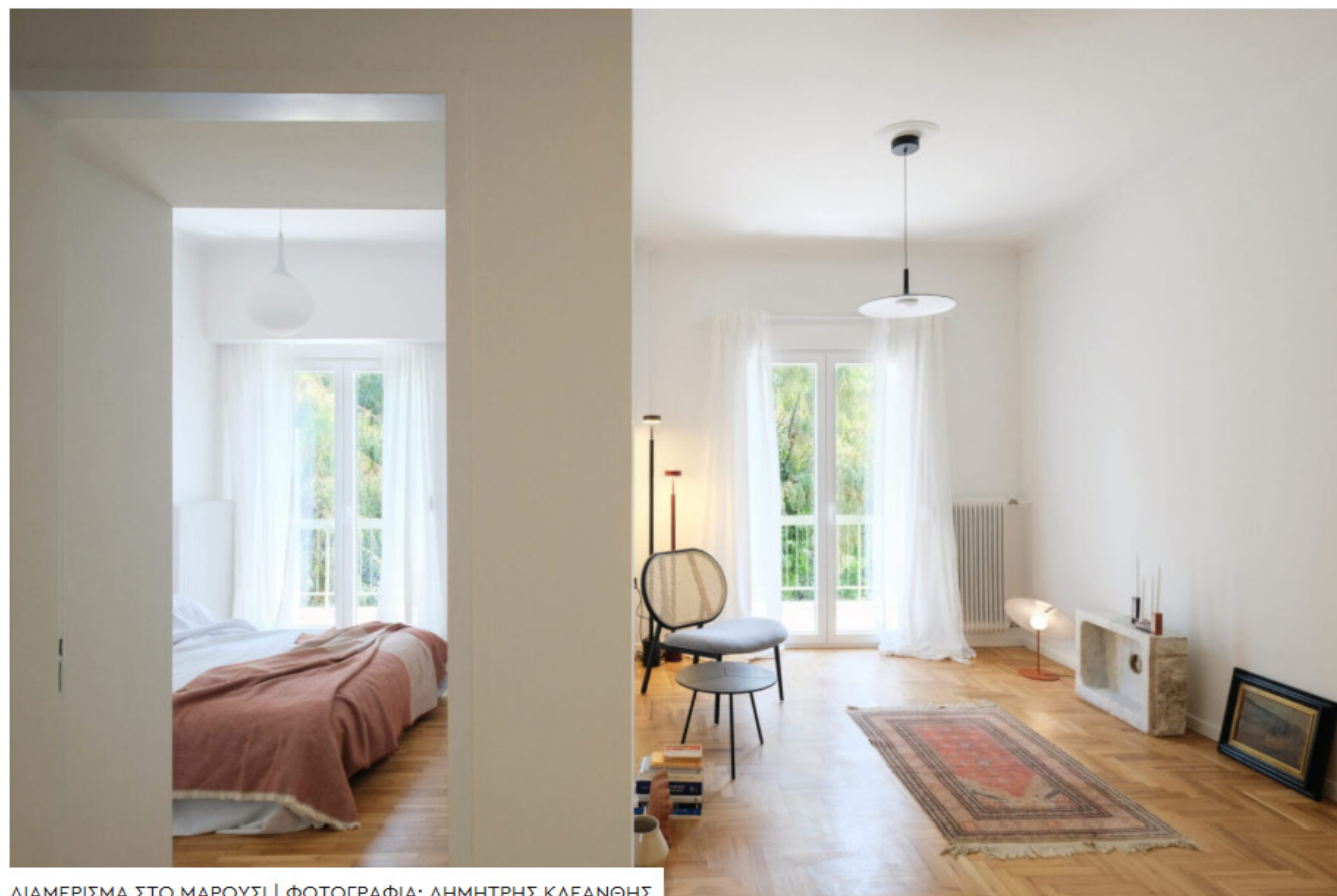
ΔΙΑΜΕΡΙΣΜΑ ΣΤΟ ΜΑΡΟΥΣΙ